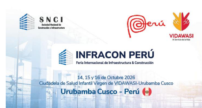
Infracon Perú 14 al 16 de octubre