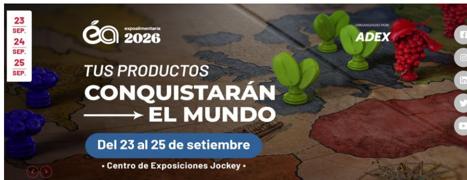
Expoalimentaria Perú 2026 23 al 25 de septiembre

Este año, COLPERÚ coordinará la participación de empresarios colombianos y peruanos en el marco de las ferias a través del desarrollo de misiones de exploración técnica y comercial.