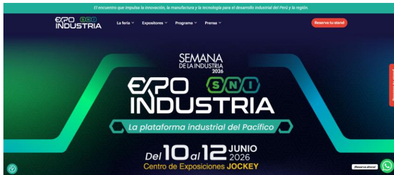
Expo Industria 10 al 12 de junio

Este año, COLPERÚ coordinará la participación de empresarios colombianos y peruanos en el marco de las ferias a través del desarrollo de misiones de exploración técnica y comercial.