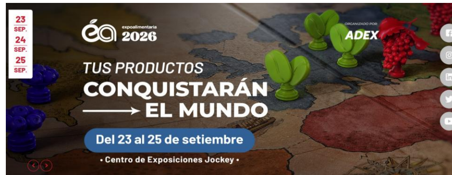
Expoalimentaria Perú 2026 23 al 25 de setiembre