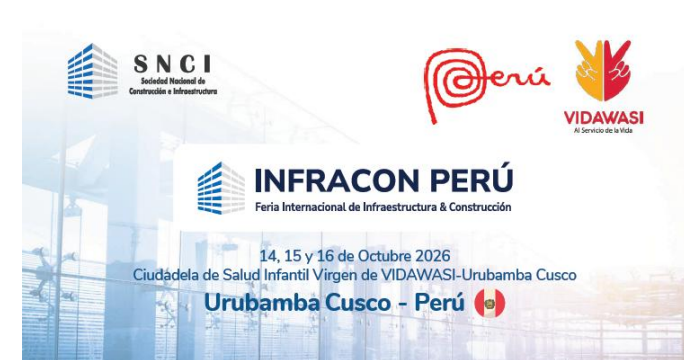
Infracon Perú 14 al 16 de octubre